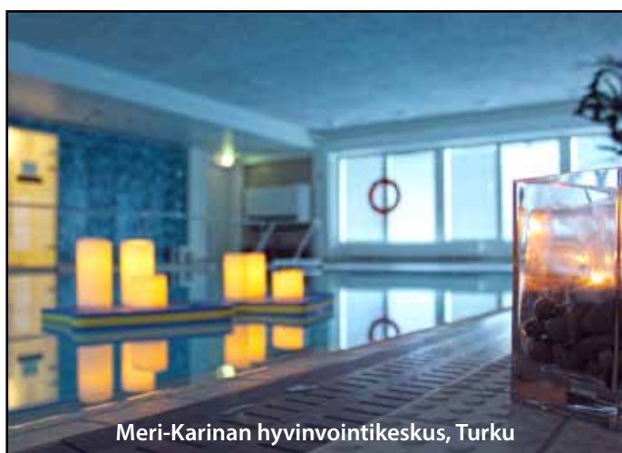
Meri-Karinan hyvinvointikeskus, Turku