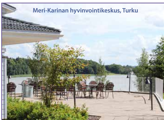
Meri-Karinan hyvinvointikeskus, Turku